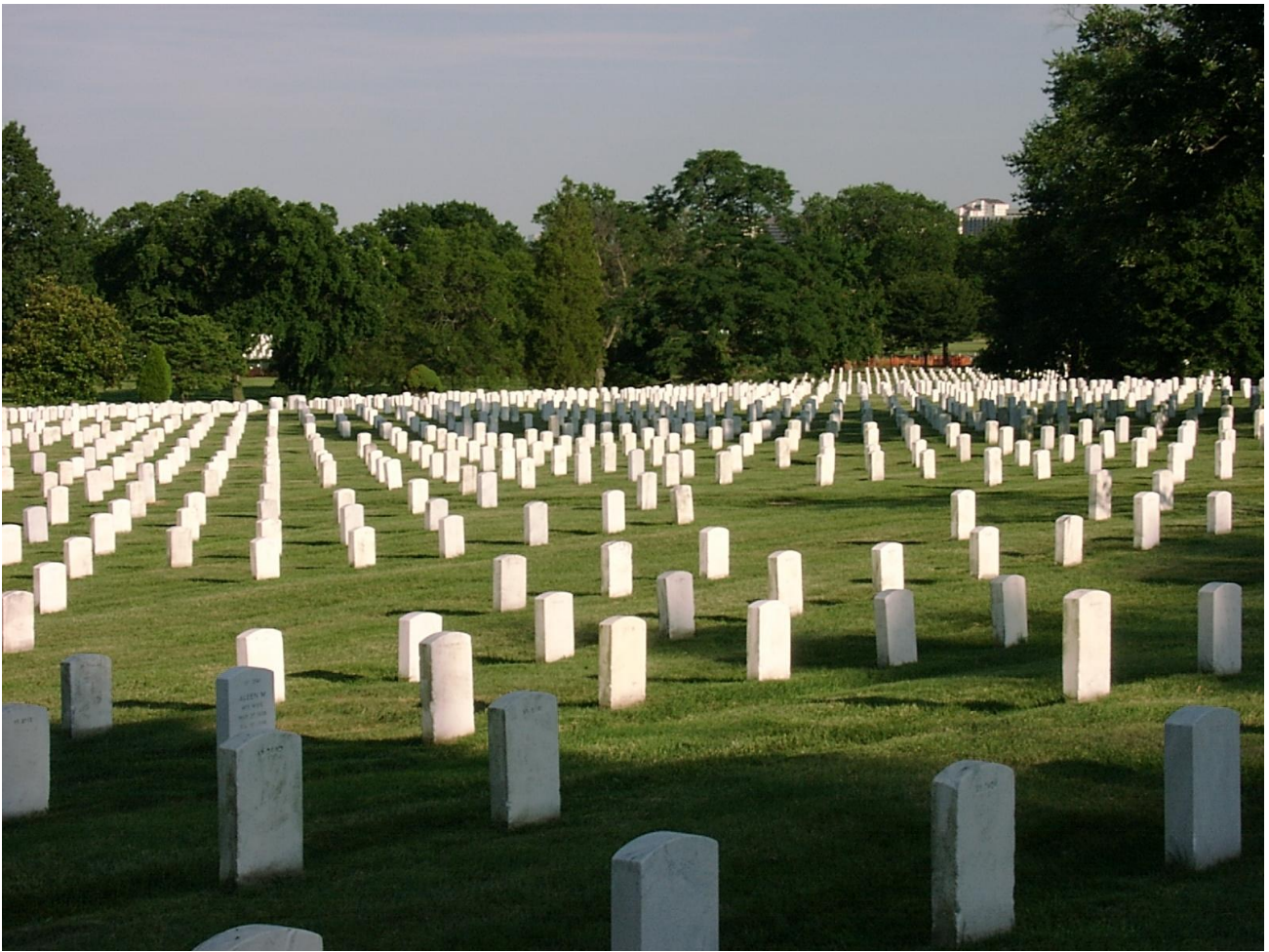
Cmentarz Narodowy w Arlington