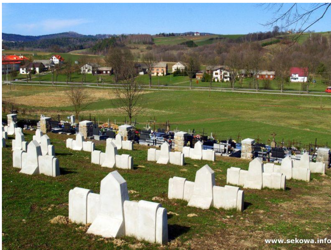
Panorama z cmentarza

Cmentarz wojenny w Olszynach znajduje się w centrum wsi, graniczy bezpośrednio z cmentarzem parafialnym. Został założony na planie prostokąta i jest ogrodzony kamiennymi słupami, które są połączone płotem z podwójnych żelaznych drabinek. Główne wejście na cmentarz stanowi potężna kamienna brama w formie półkoliście sklepionej arkady, zwieńczona kamiennym krzyżem łacińskim. Drugie, skromne wejście, zlokalizowano od cmentarza parafialnego. Jego powierzchnia wynosi około 900 metrów kwadratowych