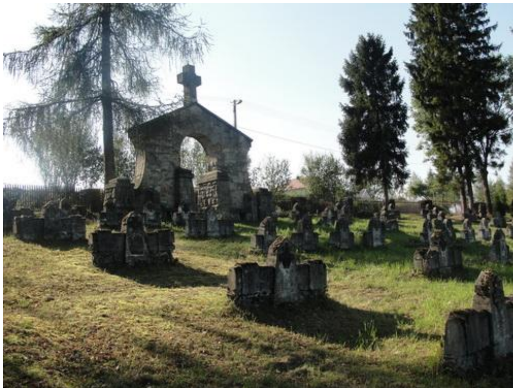
Widok cmentarza przed remontem...