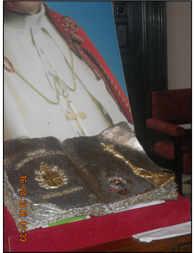
Relikwiarz z ampułką krwi Błogosławionego Jana Pawła II

Zapraszamy do obejrzenia zdjęć z tej uroczystości, które znajdują się na stronie internetowej szkoły.