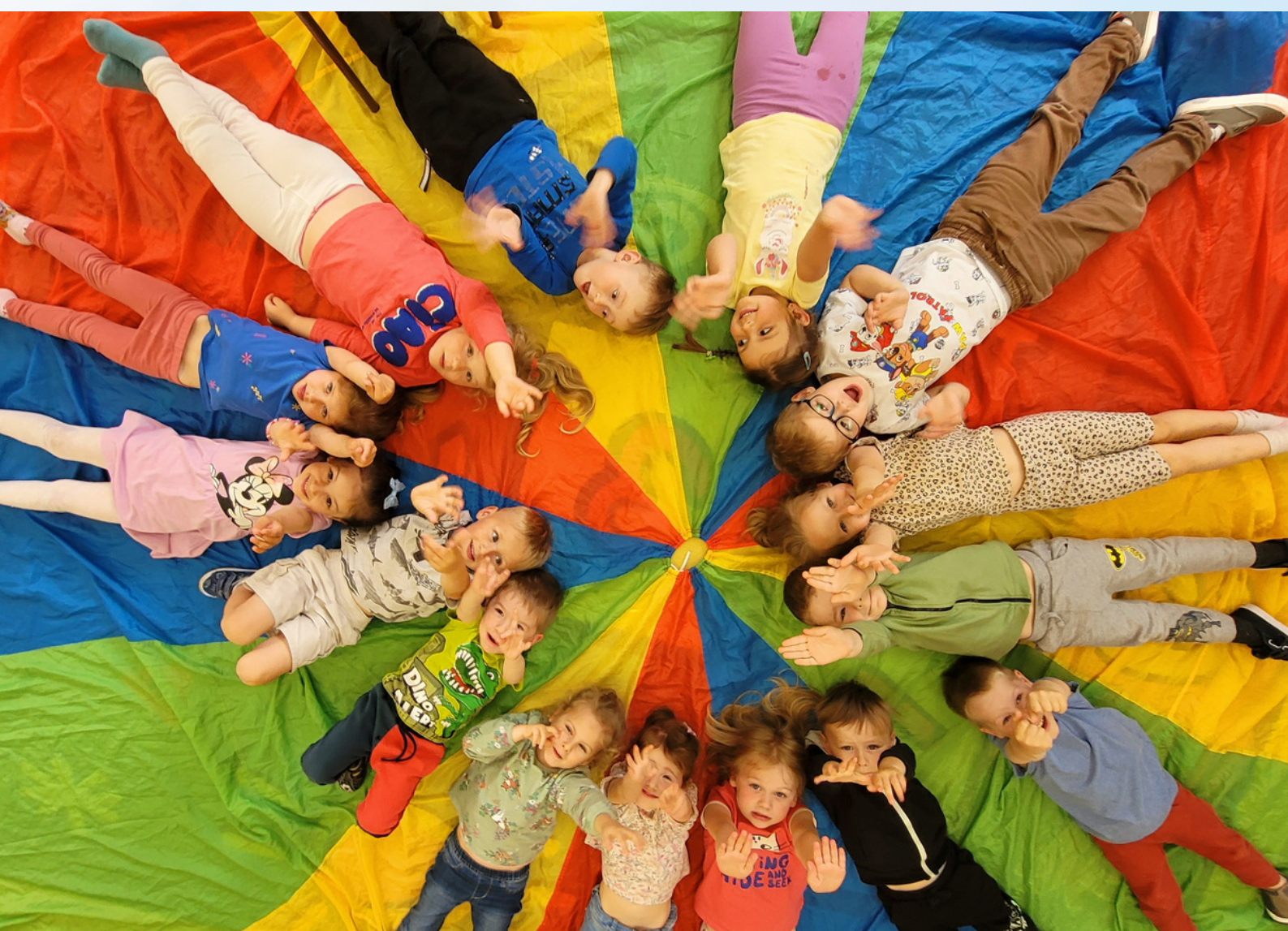
Grupa przedszkolna - Motylki

GAZETKA SZKOŁY PODSTAWOWEJ IM. JANA PAWŁA II W OLSZYNACH