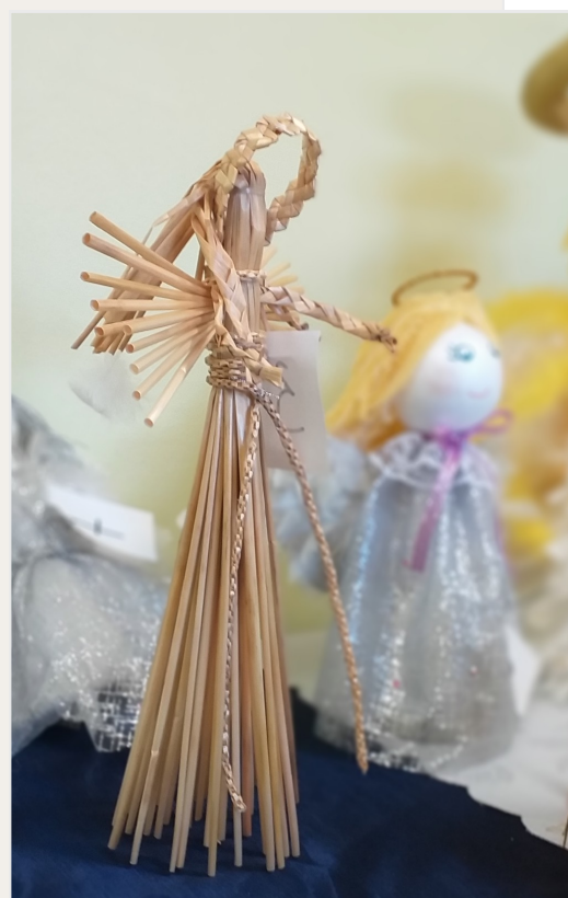
Prace konkursowe uczniów naszej szkoły

MÓWIĄ DO PASTERZY KTÓRZY TRZÓD SWYCH STRZEGLI ABY DO BETLEJEM CZYM PRĘDZEJ POBIEGLI BO SIĘ NARODZIŁ ZBAWICIEL WSZEGO ŚWIATA ODKUPICIEL "GLORIA, GLORIA, GLORIA IN EXCELSIS DEO"