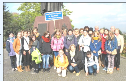
Uczestnicy pielgrzymki z 2013 r.

Na doroczne spotkanie modlitwne przybyli księża, dyrektorzy, nauczyciele, wychowawcy, katecheci oraz dzieci i młodzież szkół noszących imię bł. papieża Jana Pawła II - łącznie 17,5 tys. osób z 1200 szkół z całej Polski. Pielgrzymka miała szczególny wymiar, ponieważ w tym roku Rodzina Szkół im. Jana Pawła II obchodziła 15-lecie istnienia. Naszą szkołę reprezentowało 43 osoby w tym przedstawiciele grona pedagogicznego, rodzice oraz dzieci z klas V-VI i młodzież z klas I-III gimnazjum.