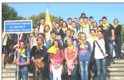
Uczestnicy pielgrzymki z 2014 r.