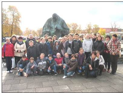
Uczestnicy pielgrzymki z 2012 r.

Spotkanie było okazją do uroczystej inauguracji Roku Wiary przez młodych i okazją do modlitwy w intencji kanonizacji papieża z Polski.