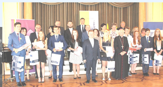
Łódź 2016 r.