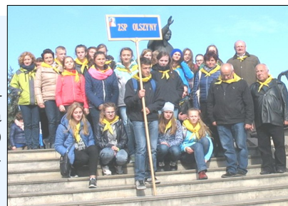
Uczestnicy pielgrzymki z 2015 r.

Pielgrzymka Szkół im. Jana Pawła II odbyła się pod hasłem „ Jan Paweł II - Patron Rodziny ”. W spotkaniu wzięło udział 450 pocztów sztandarowych szkół noszących imię Jana Pawła II z całej Polski i jedna z Litwy. Na placu przed wałami zgromadziło się ok. 20 tysięcy pielgrzymów. Pielgrzymi w dużym skupieniu przeżyli to wydarzenie. Po zakończeniu Eucharystii wyruszyli w dalszą podróż do Centrum Jana Pawła II do Krakowa.