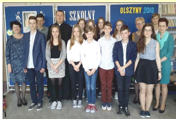
Uczestnicy II edycji Konkursu

Skład i opracowanie graficzne: mgr Katarzyna Bąk,