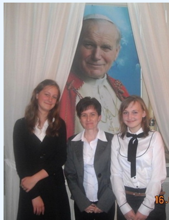
Kraków 2012 r.

Ogólnopolski Konkurs Wiedzy „Papież Słowianin”