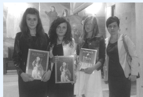
Kraków 2014 r.