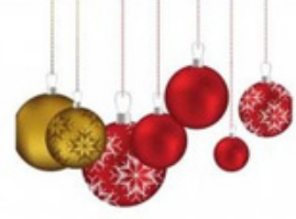
Bauble/ Christmas ornaments