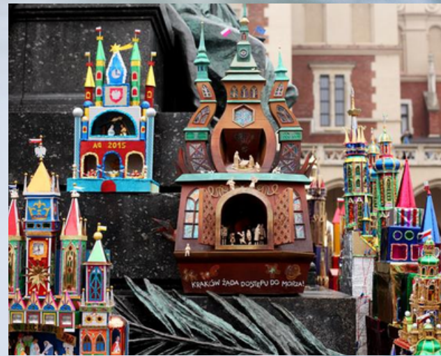
Szopki biorące udział w konkursie są prezentowane na krakowskim rynku, fot. Shutterstock

W Polsce najbardziej znane są szopki krakowskie. Historia krakowskich szopek sięga XIX wieku. Jako pierwsi konstruowali je rzemieślnicy, głównie cieśle i murarze. Zimą, czyli poza sezonem budowlanym, była to dla nich dodatkowa forma zarobku. Z czasem zaczęły wyodrębnić się dwa rodzaje szopek: mniejsze, do postawienia pod choinkę, oraz sięgające nawet kilka metrów makiety z wieżami, przeznaczone do odgrywania jasełek. Już wtedy chodzono z nimi od domu do domu i kolędowano.