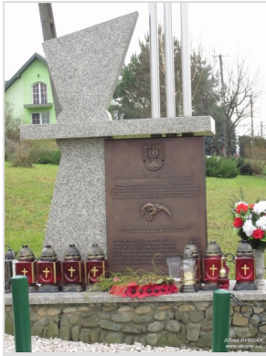
Pomnik Poległych Lotników

Jednym z ważniejszych, dla naszej społeczności, epizodów II wojny światowej był tragiczny lot załogi Liberatora GR-R (EW275), niosącej pomoc powstańczej Warszawie.