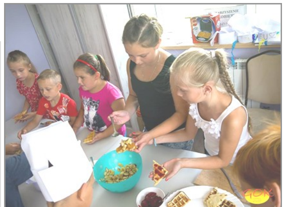
Uczestnicy spotkań w trakcie zajęć