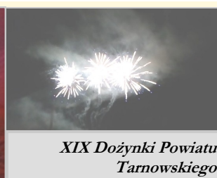
XIX Dożynki Powiatu Tarnowskiego

W dniach 26-27 sierpnia 2017r. w Gromniku odbyły się XIX Dożynki Powiatu Tarnowskiego . Festyn, zabawa i koncerty trwały aż dwa dni. W pierwszy dzień wieczorem odbył się koncert zespołu Piersi (znany zespół, ich najbardziej znana piosenka to „ Balkanica ”). Na koncercie zgromadziły się tłumy, gdzie przy fajnych piosenkach spędziliśmy czas na zabawie. Zespół grał bardzo długo, co jeszcze bardziej dodało uroku całej zabawie. Pod koniec festynu zespół zrobił piękny gest. Na ich koncert przyjechały osoby niepełnosprawne na wózkach inwalidzkich, oczywiście mieli miejsca przed tłumem by lepiej widzieć. Przy ostatniej piosence cały zespół zszedł do nich ze sceny podziękował im za przybycie i wspólnie zakończyli koncert. Po wspaniałym koncercie gwiazdy rozdawały autografy i robiły sobie zdjęcia z fanami.