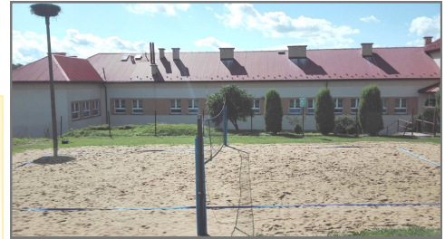
Boisko przy SP w Olszynch